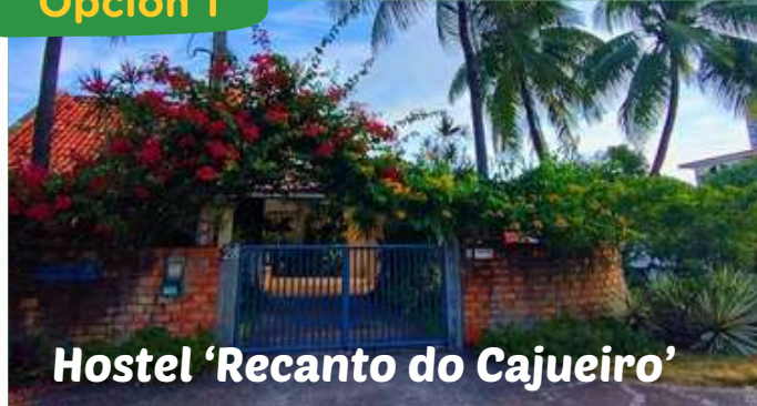
Hostel 'Recanto do Cajueiro'

Barrio Cruz das Almas, a dos cuadras de la playa.